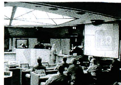
アメリカのハイテク法廷

IT時代の現在では、速記官自らの研究開発によるコンピューターを利用した電子速記技術がほぼリアルタイムに証言を記録化することを可能とし、裁判の迅速化が求められている中、大いに活躍しています。