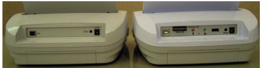
でも、バックスタイルはこんなに違いが！ ウェイブ（左）とダイヤモンド（右）