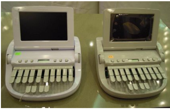
前から見るとそっくりな ダイヤモンド（左）とウェイブ（右）